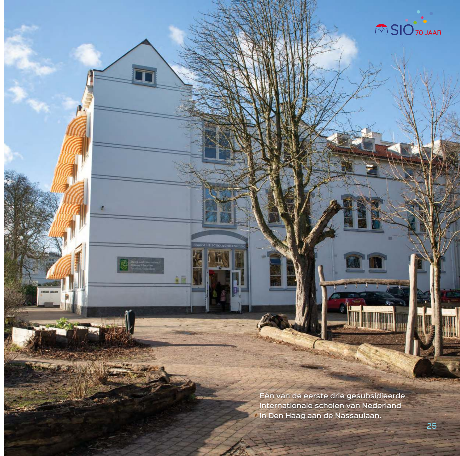
Eén van de eerste drie gesubsidieerde internationale scholen van Nederland in Den Haag aan de Nassaulaan.

Wat is de huidige staat van het internationaal onderwijs in Nederland?